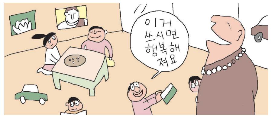
그림 · 박구원

“원장 시님~ 원장 시님~” “우리 초록이 오늘 기분 좋구나, 왜?” “원장 스님 이거 써요.” 그러더니 어린이집 가방을 뒤적뒤적하더니 노란 연꽃가방에서 신용카드 하나