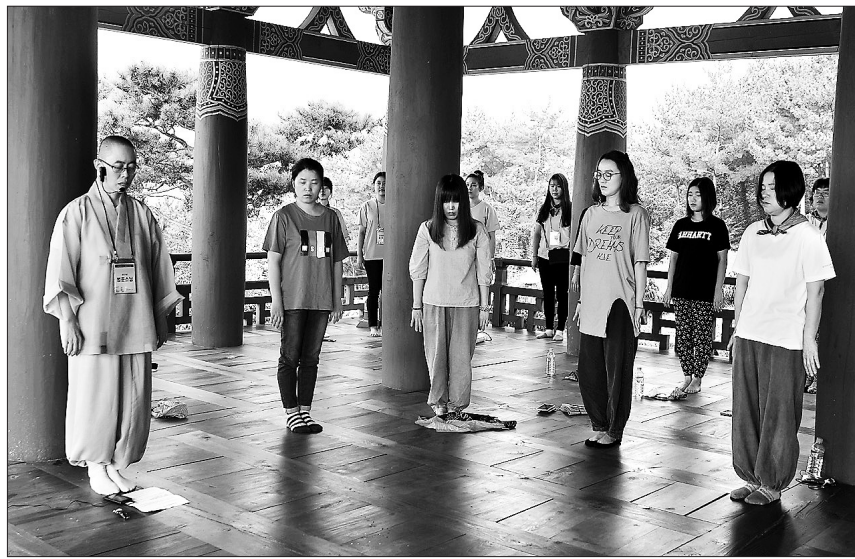
‘행복한 마음정원 가꾸기’ 참가자들이 경주 금강대에서 알아차림에 집중하기 위해 요가명상을 체험하고 있다.