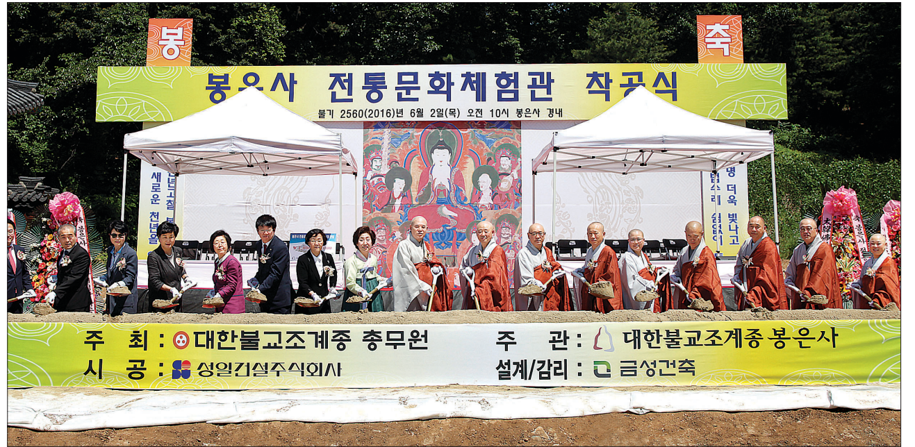
서울 봉은사, 전통문화체험관 불사 착수

제9교구본사 동화사 출가지도법사 능견 스님(운문사 교무)은 “운문사에서는 행자들에게 ‘왜 윤력을 해야 하는가’에 대한 이해를 먼저 구한다”면서 “일반적으로 행자들에 대한 배려와 관심이 부족하다. 수계 전까지 정신적으로 단단하게 해주는 역할을 스님들이 해줘야 한다”고 강조했다. 신성민 기자