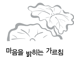
마음을 밝히는 가르침