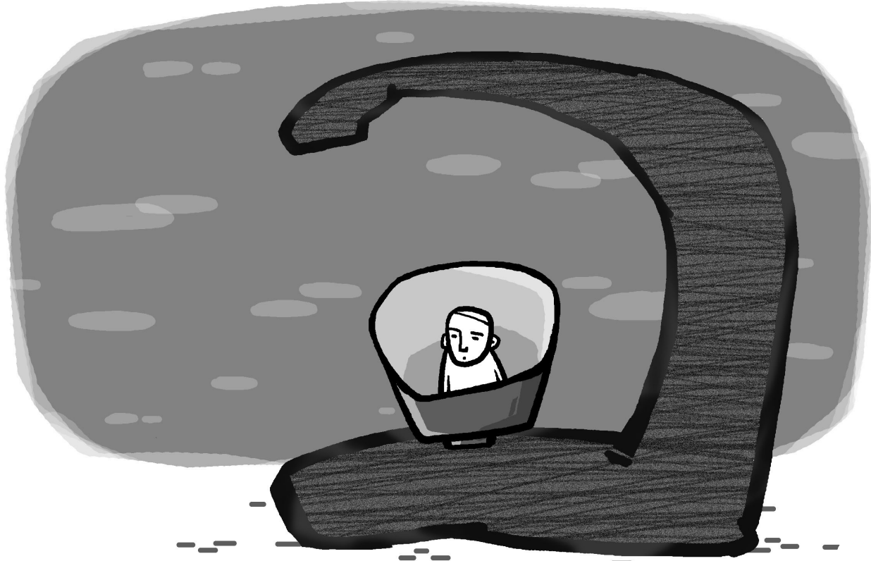
그림 · 최주현