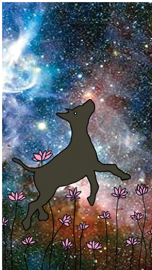
그림 · 강병호

음을 어루만져주어서 정말 고마웠다. 검둥이가 슬금슬금 다가왔다. 용케도 목줄을 푸는 데 성공한 모양이었다. 검둥이는 콧구멍을 벌름거리며 복슬이의 기색을 살폈다. 복슬이가 검둥이를 노려봤다. 콧잔등에 잔뜩 주름을 잡고 으르릉거리다가 캉, 하고 날카롭게 짖었다. 검둥이는 꼬랑지를 내린 채 뺨를 뒷걸음질 쳤다. 내가 뭐라고 했더니, 너 같은 무지렁이는 복슬이의 신랑이 될 수 없다고 했다. 저만큼 도망을 치고서도 미련이 남았는지 쉬 떠나지 못하고 어슬렁거리며 검둥이를 향해 꽃방귀를 뀌었다. * 일주문 밖에서 추레한 사내가 휘청거렸다. 손으로 아픈 다리를 짚으며 걸음을 디딜 때마다 잘 굽혀지지 않는 다리가 허공에 호를 그렸고, 운뭉이 여린 가지처럼 흔들렸다. 그는 이따금 걸음을 멈추고 꼬질꼬질한 소매로 이마의 땀을 닦았다. 걷는 것 자체가 그에게는 고행이었다. 정작 힘든 것은 그의 성한 다리인 것 같았다. 성한 다리 한 짝에 그의 무게와 더불어 온 우주의 무게가 실려 있는 것 같았다. 나는 몸을 낮추고 사납게 으르렁거렸다. 그에 대한 적의는 훈이 되어서도 사라지지 않았다. 아주 오래전에도, 또 지금도 나에게는 그에게 맞설 힘이 없었다. 그것이 나를 비참하고 두렵게 만들었다. 그날, 시구 스님이 출가를 결심했던 날, 그도 나도 불구가 되었다. 나는 다리와 가슴뼈가 부러져