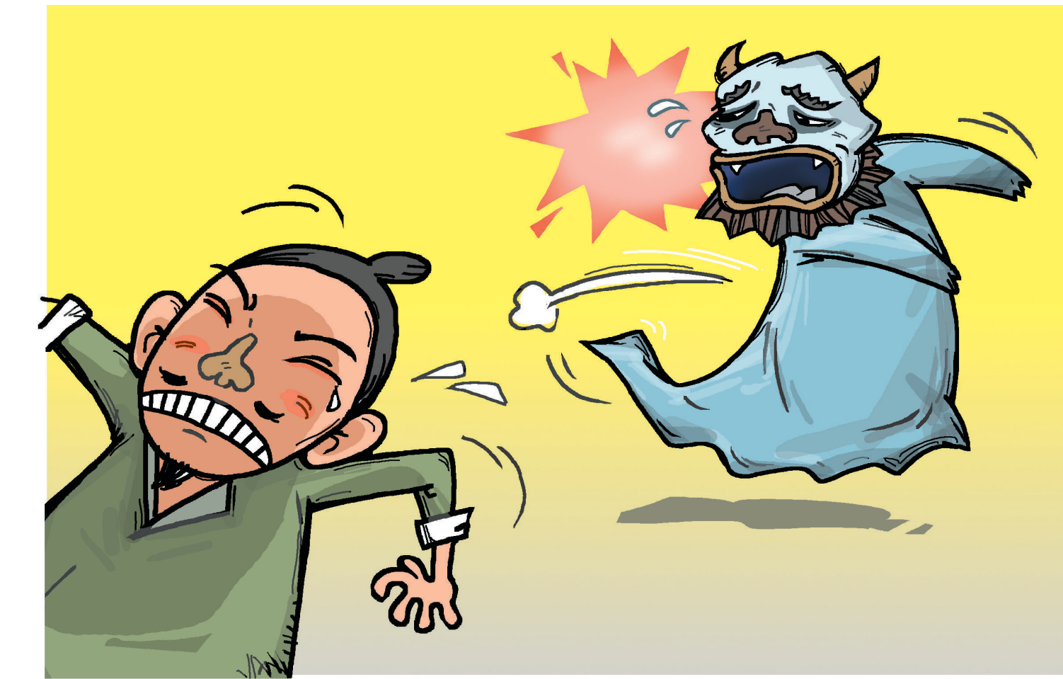
그림 · 최주현

나칠계 : 제 아버지가요, 시골 분이시거든요. 아주 시골은 아니구, 대도시 근방인데, 어느 날은 피치 못하게 밤늦게 이웃마을을 다녀올 일이 있었어요. 어찌다 보니 일이 늦게 끝나서 새벽 두시쯤에나 집으로 돌아오게 되었는데, 좀 밤길이라 무서웠지만, 그리 먼 길도 아니고 해서 용기를 내어 돌아오는데... 오는 길에 묘지가 많은 산자락을 지나오는 곳이 있었어요. 그러지 않아도 좀 쭈뼛한 느낌이 들어 조심스럽게 지나고 있는데, 멀리 보이는 뒷등에 웬 하여벌건한 것이! 깜짝 놀라 보니 완전히 사람 모습이라네요. 입은 웃이 좀 치렁한 것이 해괴한데다가, 이상한 춤 동작 같은 것을 하고 있더라네요. 새벽 두시경에 무덤에 그것도 이상한 웃을 입고 춤 동작같은 것을 하는 게 무어겠어요? 너무 놀라서 으악! 하고 줄행랑을 쳤다네요. 뒤에서 깔깔~ 음산하게 웃는 소리가 들리는데, 금방 뒷덜미를 잡아채는 것 같아 정신없이 달아났어요. 겨우 동네로 돌아와서 잠도 못자고 날을 새웠어요. 그 이른날 사람들에게 이야기하고 함께 그 묘지 있는 곳으로 가 보았더니 아무 자취도 없었어요. 그런 귀신이 틀림없지요. 아버지도 틀림없는 귀신이었다고 하시더군요. 새벽 두