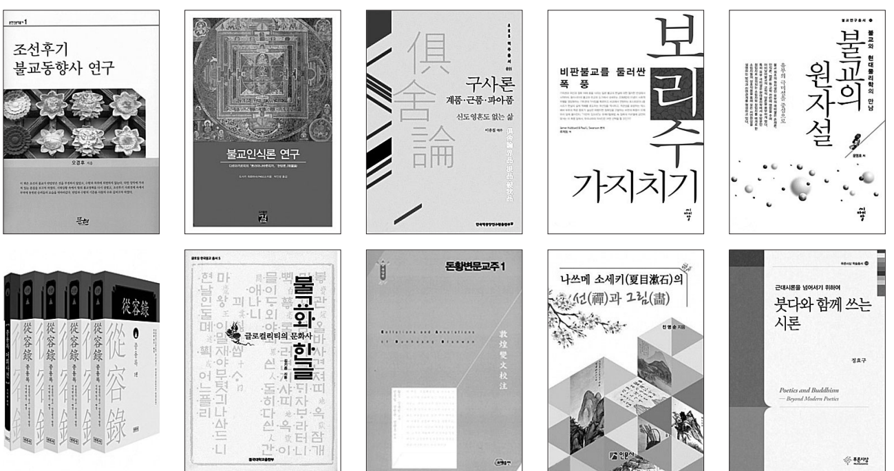
대한민국 학술원의 올해 우수 학술도서 중 불교 관련 학술서 10종. 불교 교리부터 역사, 문학, 동향 연구까지 다채롭다.