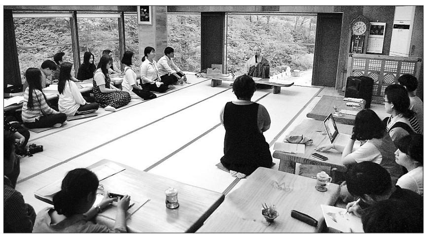
조계종 포교부장 무각 스님과 대학생불자들이 간담회를 하고 있는 모습.

캠퍼스포교를 위해 일선 현장에서 노력하고 있는 한국대학생불교연합회 활동가들이 산사에서 지친 심신을 달래고, 포교역량을 다지는 기회를 가졌다.