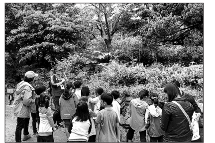
강화 난정초교 학생들이 하루 숲 체험에서 해설사의 설명을 듣고 있는 모습.

경쟁사회에서 학업에 지친 아이들에게 자연의 소중함을 알리는 프로그램이 사람에 마련됐다.