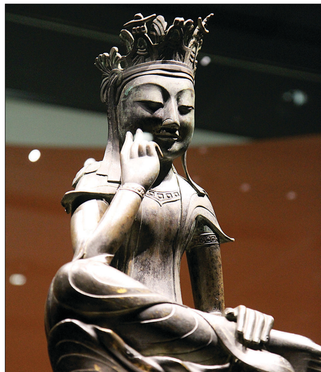
한 자리에서 만난 한국의 국보 제78호 금동반가사유상(사진 왼쪽)과 일본의 국보 주구사(中宮寺) 반가사유상(사진 오른쪽)의 모습. 한국과 일본의 반가사유상 한자리에서 만난 역사적인 기념전시지만, 일본 불교계만 불교 의식을 허용해 반축을 하고 있다.