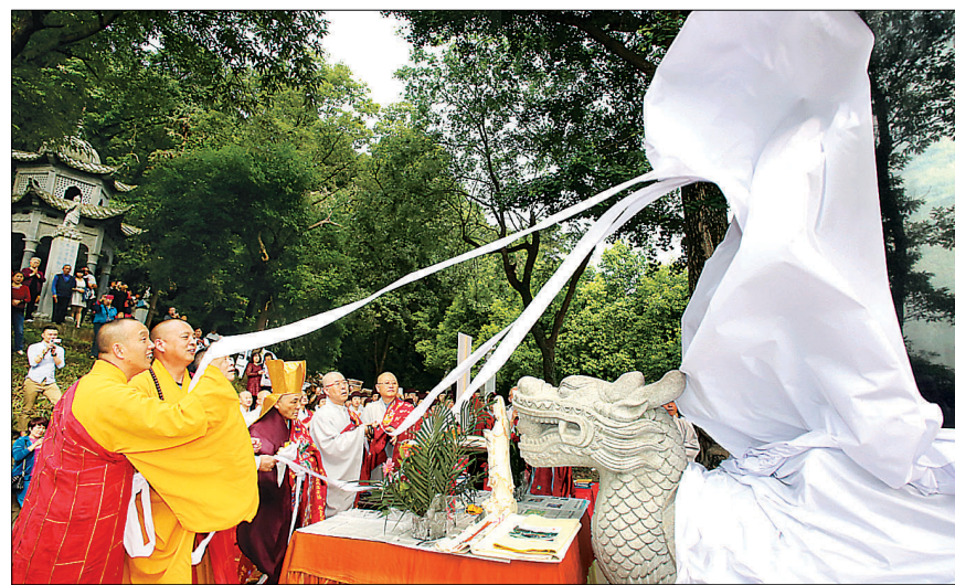
천태종은 5월 18일과 20일 각각 중국 옥천사와 정거사에서 ‘천태불법흥포세계평화비’ 제막식을 거행했다. 사진은 옥천사 제막식.

의를 다지고, 중생제도의 길을 넓혀 나가고자 노력하고 있다”고 강조했다.