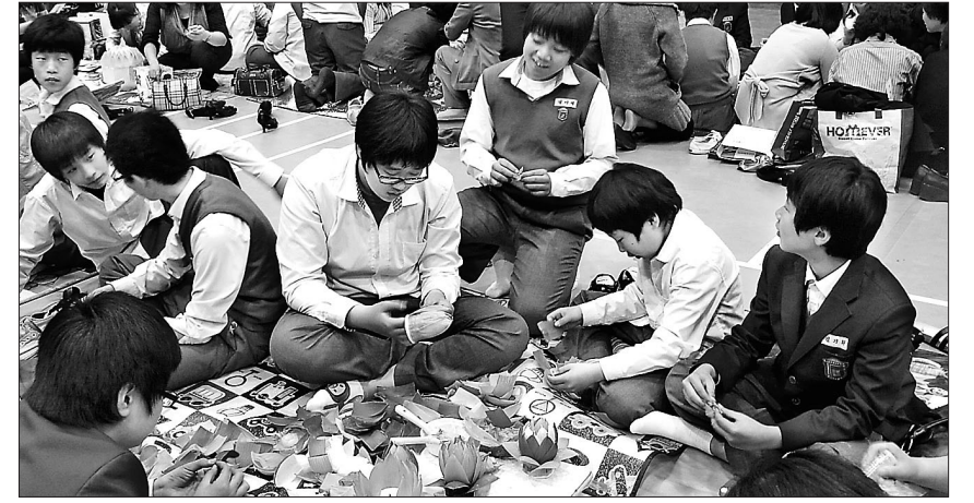
동국대부속중학교 학생들이 연등을 만들고 있다. 앞으로 종교교육은 특정 종교의 교리를 배우는 것에서 학생 스스로 성찰을 할 수 있는 방향으로 변화한다.

하면서 현장 적합성 제고를 위해서는 현장 교사 외에도 관련 학계, 종교계 등을 보강할 필요가 있다"면서 "국가 수준의 교육과정에 기초한 교재 개발이 이뤄지도록 행정·재정적인 지원체제의 구축, 교과서의 공동개발 및 활용 등을 고려해