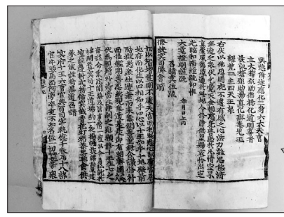
부산시 문화재로 지정예고된 장안사 예수시왕생칠재의찬요

부산시는 5월 18일 '장안사 예수시왕생칠재의찬요'를 시 지정문화재로 지정예고한다고 밝혔다. 20일간의 예고기간을 거친 뒤 최종 확정할 예정이다.