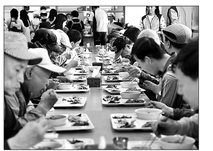
5월 11일과 12일 성북장애인복지관에서 진행된 무료 공양 나눔 행사가 지역주민들이 함께하고 있다.