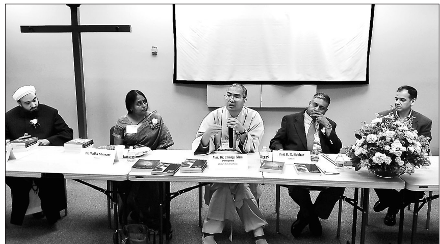
통도사 워싱턴포교당 연화정사는 5월 15일 봉축행사서 2부행사로 학술대회를 마련, ‘종교간 대화와 화합’을 주제로 열린 토론을 벌였다.