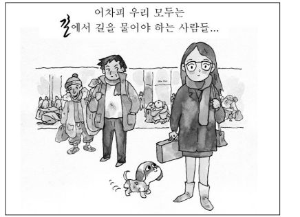
웹툰 ‘길리언’ 내용 중 일부.

종교계노숙인복지재단 측은 “이 웹툰을 통해 노숙인에 대한 부정 편견을 없애고, 우리와 함께할 수 있는 존재라는 것을 인지시킬 바란다”며 “서로의 거리