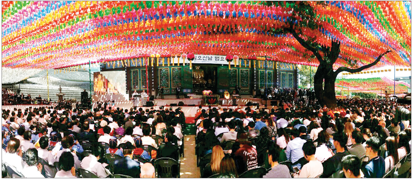
부처님오신날 조계사는 연화장세계

지역별 대중공사에서는 차기 총무원장 선거에서의 우선가치로 '출가 승단의 평등한 참정권 확보'가 44%의 지지를 받았다. '금권선거 등 선거과열 방지'는 23% 밖에 득표하지 못했다. 비구 스님의 참정권 확보 인식이 컸음도 드러났다. 한편 대중공사는 5월 18일 오전 10시 서울 잠실 불광사에서 2차 중앙대중공사를 열고 주제별 논의 결과까지 포함해 최종안을 중회 총무원장선출제도혁신특위에 제출할 예정이다. 제도 개선의 공은 6월 21일 예정인 중앙총회로 넘어간 상황이다. 노덕현 기자