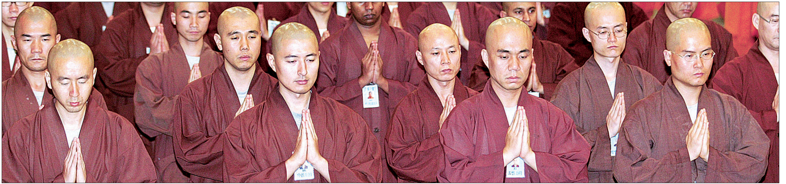
조계종 행자교육원에서 사미·사미니계를 받기 위해 장례합장을 하고 있는 출가자들. 발심을 통한 자질있는 출가자가 늘어나 승가가 안정적으로 운영될 수 있다고 관련 전문가들은 입을 모은다.