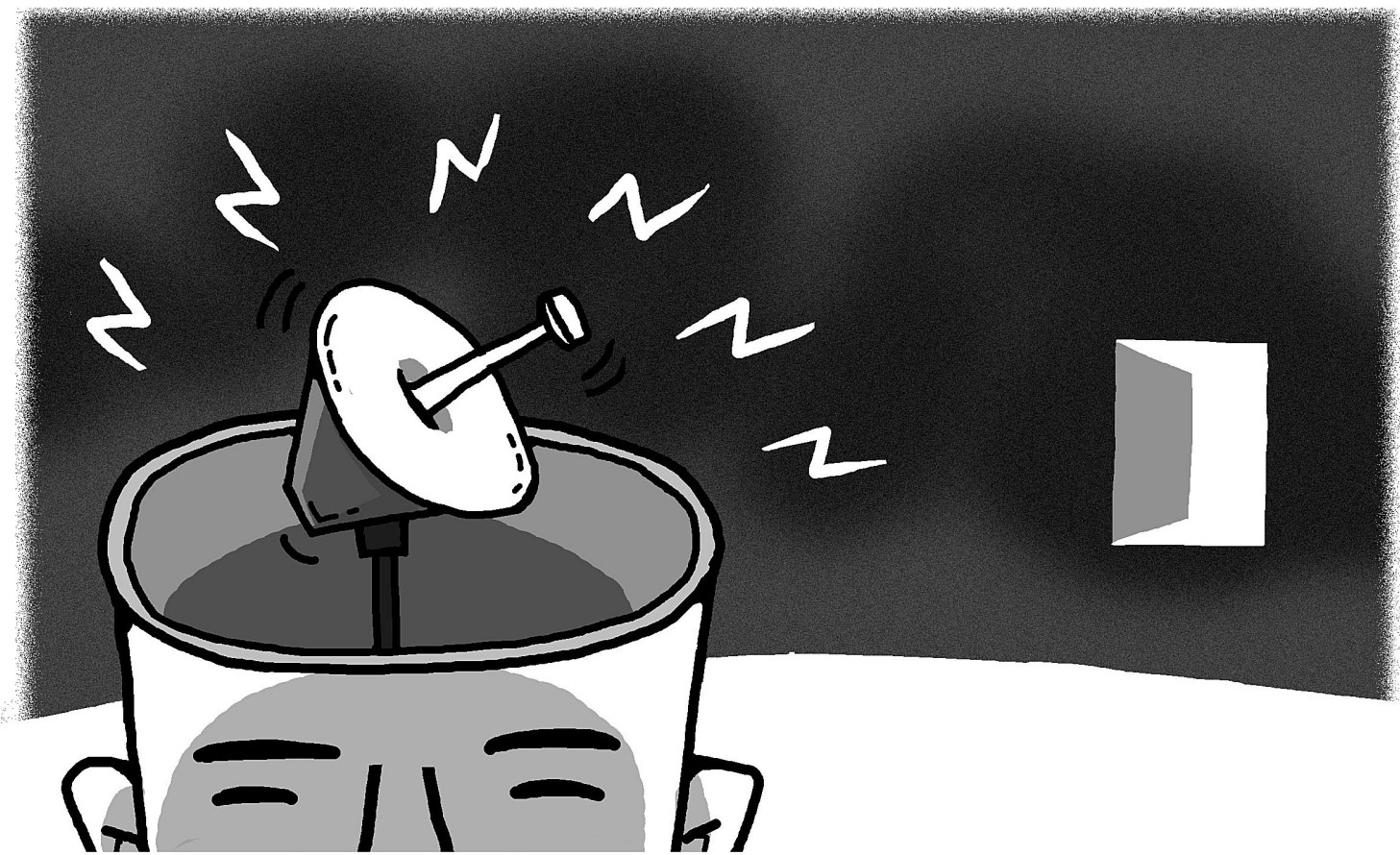
그림 · 최주현

우리들의 인간에게도 왼쪽 두뇌와 바른쪽 두뇌, 양면을 작용하는 핵점이 있습니다. 말하고 작용하고 행동하고 크고 작은 걸 알고, 좋고 나쁜 걸 알게 하는 그 핵점입니다. 그래서 마음에서 모든 것을 거기다 맡겨 놓으면 그 핵점으로 통신이 돼서 각 부처로다가 하달이 되죠. 이걸 누진이라 그럽니다. 그 핵점을 누진이라고 한다면 바로 거기서 사대로 통신이 돼서 모든 공장에서 알게 되는 거죠. 어느