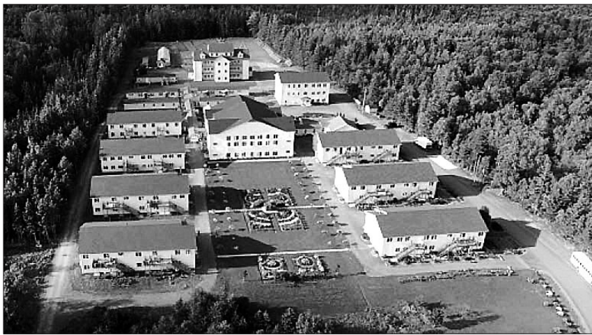
만화 '빨간머리 앤'의 고향으로 유명한 캐나다 프린스 에드워드 섬(Prince Edward Island)에 대규모 불교 사원이 조성됐다.