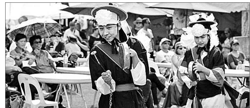
호주 퀴즈랜드 브리즈번에서는 4월 28~30일 부처님오신날 행사가 열렸다. 사진은 행사에서 사물놀이패 공연을 하고 있는 한국인들.

한편 사우스뱅크에서 열린 불교 페스티벌에는 태극권·용선(龍船) 경주·명상·아기부처 관육·쿵푸 시범·문화 역사 강연 등 다채로운 행사가 마련됐으며, 브리즈번타임즈는 한국인들의 사물놀이패 공연사진을 기사와 함께 게재했다. 이보형 객원기자