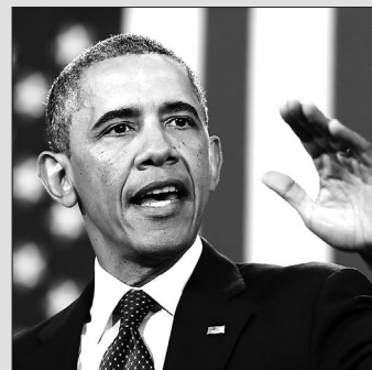
오바마 대통령(사진 오른쪽)이 보낸 봉축서신 원문.

남방 율력체계로 5월 15일이지만 1956년 제4차 세계불교도의회(WFB) 연례총회에서 양력 5월에 보름달이 뜬 날을 베사크데일로 지정했다. 올해 베사크는 5월 21일이다.