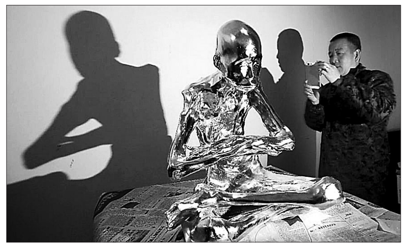
중승려 범구, 황금 미라 되다 13세에 출가한 후 93년 간 고행해 온 푸호(Fuhou) 스님의 범구(法鑪; 서신)가 금으로 덮였다. 푸호 스님은 생전 염원에 따라 2012년 입적 후 미라 상태로 원통형 독에 보관됐으며, 지난 1월 대중에 공개됐다. 영국 신문 'The Independent'는 5월 2일(현지시간) "스님의 몸을 거스르 감싸고 옷칠을 한 뒤, 마침내 금박으로 덮였다"며 "푸호 스님은 불교 신자들을 위해 산꼭대기 유리함에 보관될 예정"이라고 밝혔다. 박아름 기자