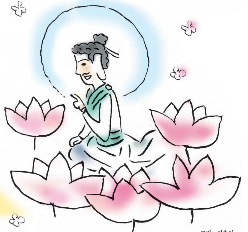
그림 · 김홍인