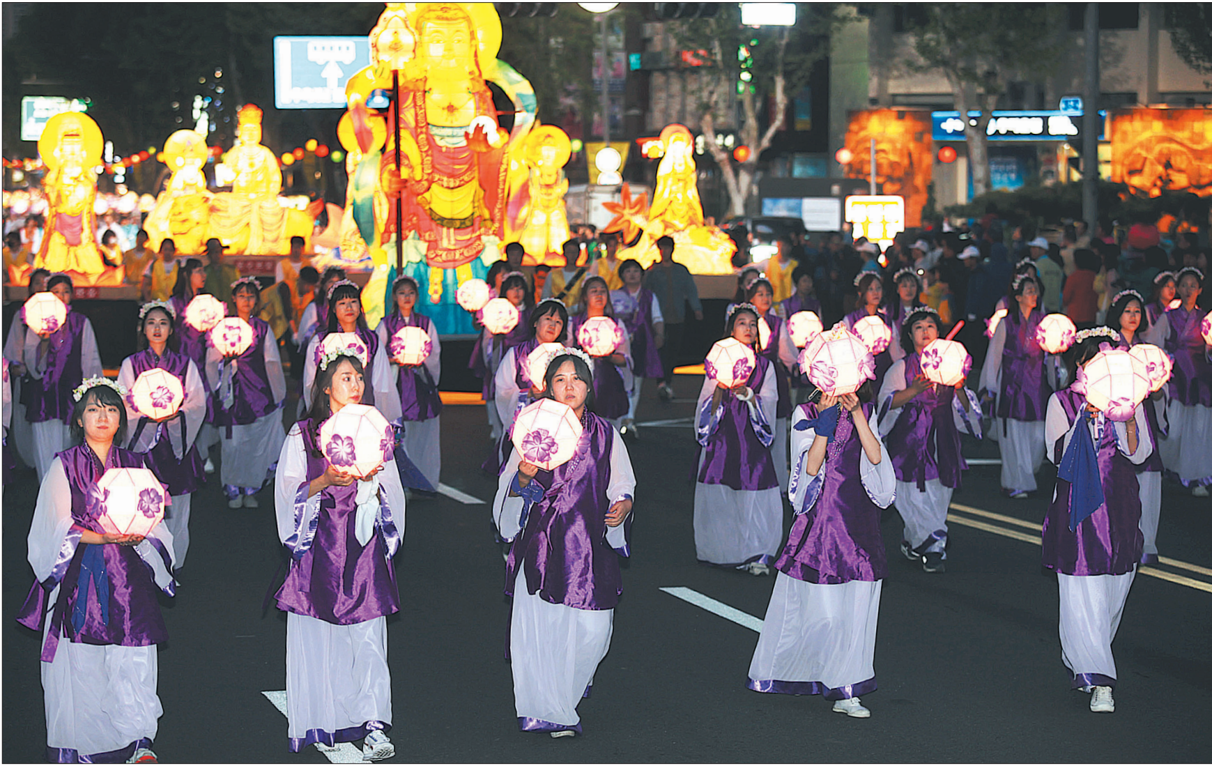
젊은 불자들이 만든 10만 오색 연등 물결 불기2560년 부처님오신날을 축하하기 위한 연등회가 5월 7-8일 서울 중로 일원에서 열렸다. 올해 연등회는 '청년과 함께하는 연등회'를 캐치프라이즈로 삼은만큼 어느 때보다 많은 20-30대 젊은 불자들이 축제에 참여했다. 사진은 서울 도선사 젊은 여성신도들이 연등을 들고 장엄등과 함께 행렬하는 모습. <관련 기사 A3, 봉축화보 A16·17면> 특별취재팀=노덕현·윤호섭·박아름 기자, 이승희 수습기자