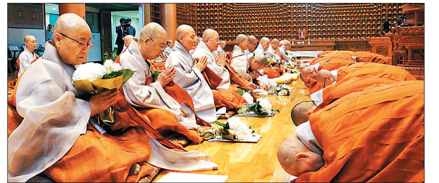
원로스님들에게 삼배로 예를 올리고 있는 전국비구니회 제11대 집행부 스님들.