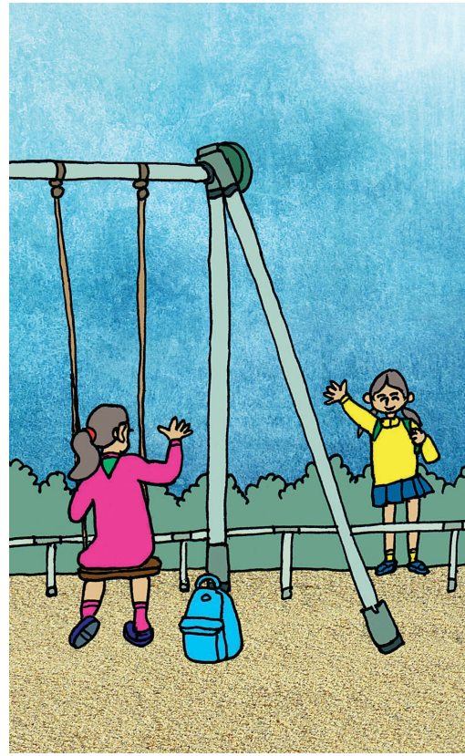
그림 · 강병호

할머니가 꼬깃꼬깃 접힌 만 원짜리 지폐 여섯 장을 아영이 앞에 놓았을 때, 아영이는 할머니가 늘 끼고 있던 반지가 사라졌다는 걸 알아차렸지만, 반지가 있던 자리에 하얗게 남아있는 자국을