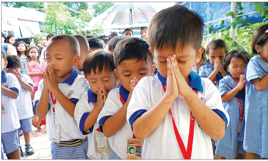
데이케어센터 아이들이 가톨릭 의식으로 아침 조화를 하고 있다.

정원이다. 필리핀 라구나주 산페드로시 사우스빌 지역은 필리핀 정부가 마닐라 수컷 빠라나케 다리밀 판자촌 지역 주민을 비롯해서 도시 빈민 주민들을 정책적으로 이주시켜 조성한 마을이다. 이곳은 마닐라 등 인근 지역의 모든 쓰레기가 모아지는 쓰레기 매립지이다. 일명 ‘쓰레기 산’으로 불리는 곳이다. 이 마을에는 약 2500가구 1만여 명의 주민이 살고 있다. 대부분의 가정은 편부모 가정이거나 조손가정으로 열악한 환경의 가정이 대부분이다. 주민의 절반 정도는 도시로 나가 일을 하고 절반은 쓰레기 매립지에서 재생활 생업 등을 하면서 생계를 이어가고 있다. 아이들의 생활과 교육은 ‘열악’ 그 자체다. 2013년 굿월드 지수적인 이주요청으로 수컷 빠라나케 다리밀 판자촌 주민들이 이곳으로 이주하게 되면서 굿월드는 이곳에 주목하게 됐고, 유치원을 세우게 된 것이다.