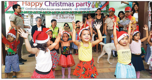
2015년 필리핀 굿월드 데이케어센터의 크리스마스 파티 모습.

있는 가장 아름다운 일이라고 생각합니다. 그 일은 종교나 사상, 국적, 인종을 내세울 일이 아니며 동시대를 살고 있는 인류가 인류에게 당연히 해야 하는 일이라고 생각합니다. 주민들 중 누군가 묻더군요. 당신들은 왜 우리를 돕느냐고요. 저는 이렇게 대답했습니다. ‘우리는 한국의 불자들입니다. 불자란 무엇이나, 부처님의 삶을 실천하는 사람들입니다. 부처님이 그렇게 사셨습니다.’ 라고요. 필리핀은 가톨릭을 주종교로 하는 국가입니다. 하지만 그들에게 부처님을 이야기했을 때, 그들은 아무런 거부감을 드러내지 않았습니다. 많은 구호단체와 봉사단체가 포교를 염두에 두고 현장을 갑니다. 그것이 당연한 일일 수도 있지만 그것이 ‘보시’라는 부처님의 가르침을 실천하는 일보다 우선할 일은 아니라고 생각합니다. 진정한 포교는 종교를 삼고 오는 것이 아니라 우리가 실천하고 있는 일이 부처님의 삶이라는 것을 알리고 오는 것이라고 생각합니다.”