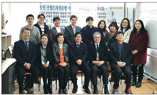
굿월드자선은행 이사진 모습.

“당신들은 왜 우리를 돕는 거죠?” “저희들(굿월드)의 다음 사업은 해외 보건소 설립입니다. 굿월드가 하고 싶은 일은 배고픈 사람에게 밥을 주고, 아픈 사람에게 약을 주고, 아이들에게 교육의 기회를 주는 것입니다. 사람이 사람에게 할 수