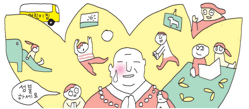
그림 · 박구원

문을 쏘아냈다. “원장 시님~ 시님은 언제 성불하세요?” 매우 근원적이면서 수행자에게는 곤란한 질문이다. 당황하는 나에게 “원장 시님이 성불하면 우리가 ‘성불하세요’라고 인사 안해도 되잖아요”라고 췌기를 박는다. “절다. 나의 완벽한 KO패다. 빨리 성불하도록 노력하겠다는 약속을 하고 얼른 자리를 떴다. 다음 날, 그 아이를 복도에서 다시 만났다. 아이가 당장 나를 반짝이는 눈으로 쳐다보면서 “원장 시님, 혹시 오늘은 성불 하셨어요?”라고 묻는다. “음, 아니, 아직...” “그럼 내일은 꼭 성불하세요.”