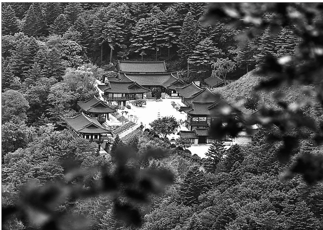
차천로가 교유했던 오대산 상원사의 전경.

그의 글재주는 얼마나 대단했던 것일까. 결론적으로 그는 속작(速作)뿐 아니라 다작(多作)에도 남다른 재주를 가졌다고 한다. 남옹의(南龍翼, 1628~1692)는 <호곡시화(壺谷詩話)>에 “(차천로) 자신이 말하길 만리장성에 종이를 붙여 놓고 내게 말을 달려 글을 쓴다면 만리장성이야 끝이 없겠지만 나의 시는 끝이 없을 것(自言貼紙於萬里長城 使我走筆則城有盡 而我詩不窮云)”이라며