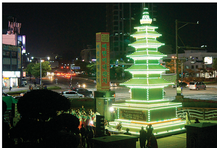
4월 17일 전주 종합경기장 주차장에서 봉행된 전북 부처님오신날 봉축위원회 점등식.

물 25호 금산사 5층석탑을 모형으로 만든 것이다. 부처님오신날을 상징하는 4월 8일의 의미를 담아 4.8m를 더해 높이 12m로 조성됐으며 부처님오신날인 5월 14일까지 불을 밝혀진다.