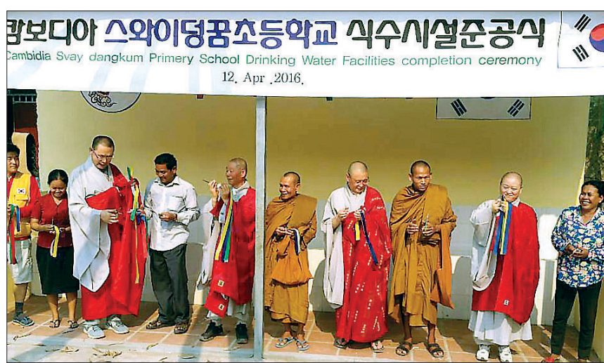
캄보디아 스와이덤퐁 초등학교 식수시설 준공식.

아울러 베트남 전쟁당시 고국을 탈출한 보트피플 난민들이 생활하고 있는 톤