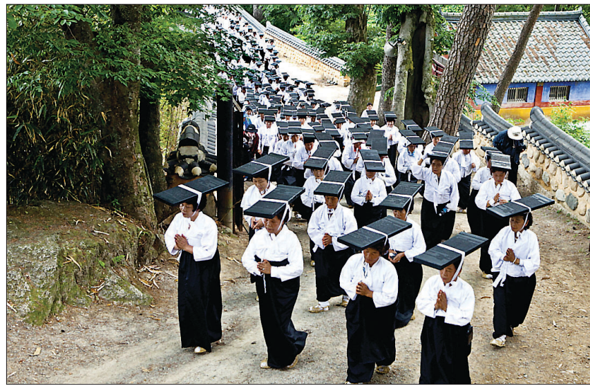
2013년 대장경세계문화축제에 참여한 대중이 대장경판 모형을 머리에 이고 정대행진 하고 있는 모습.

행사의 하이라이트인 팔만대장경 정대행진은 오후 2시 30분 구광루 앞에서 진행된다. 정대행진은 세계문화유산인 해인사 장경판전에 보관된 팔만대장경 판의 모형을 머리에 이고 해인사 도량을 따라 도는 사람들의 장엄한 행렬이다. 정대불사는 조선 태조 7년(1398년) 장경판을 강화도 선원사에서 해인사로 이운