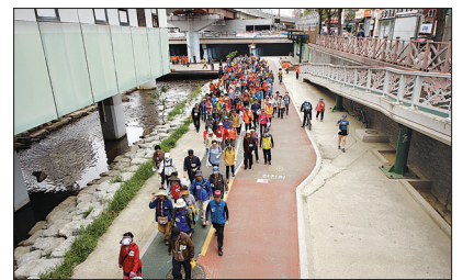
지난해 열린 금정구노인복지관 어버이날 기념 걷기대회 모습.

대회는 개회식을 시작으로 부산대역산책로, 온천정역, 명륜역, 동래역 등 총 4km 구간을 걷은 뒤 세명고 야외무대에서 열리는 부대행사로 마무리된다.