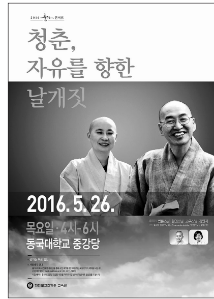
조계종 교육원의 '출가콘서트' 포스터

2014년 학인염불시연대회 대상 수상자인 보견 스님은 홀로아리랑에 맞춰 시