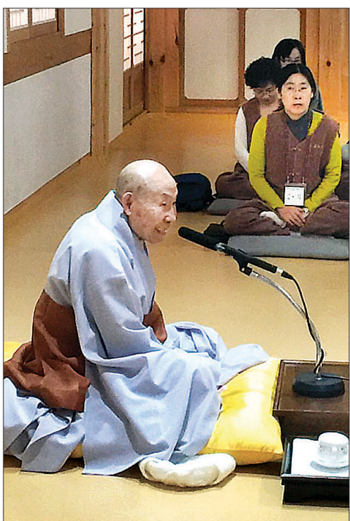
무여 스님이 순례단에 소참법문을 내리고 있다. “수행 하라”는 스님의 가르침은 명료하고 강렬했다.

축서사 선원은 5개월 안거, 하루 15시간 결제로 유명하고, 축서사 템플스테이도 365일 상설되어 축서사에 출·재가 수행자들의 발길이 끊이지 않는다.