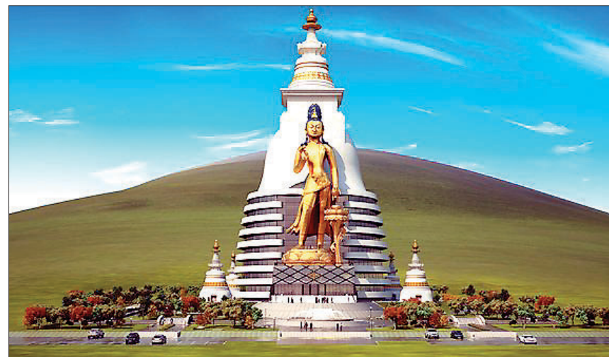
2018년 완공 예정인 몽골 내 대규모 불교명상센터는 53m 규모의 대형 미륵보살상도 조성하고 있어 전 세계인들에게 관심을 끌 것으로 기대를 모으고 있다.

몽골에 사회주의 체제가 성립한 후 몽골 스님들의 삶은 피폐해 졌다. 1930년대 스탈린 숙청기간에는 1만 7천명으로 추