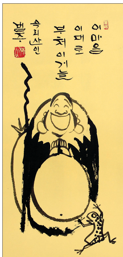
범주 스님의 해피붓다 포대화상 병풍 중 일부.

천관음도도 주목할 만하다. 선묵으로 그려진 관세음보살 주위로 표현된 황금색으로 아련하게 펼쳐진 장엄함을 더한다.