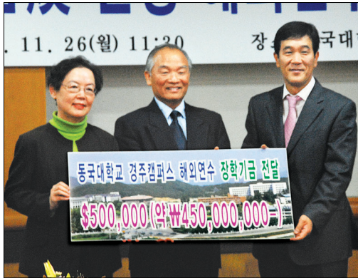
2007년 동국대 해외연수기금 전달식 모습.