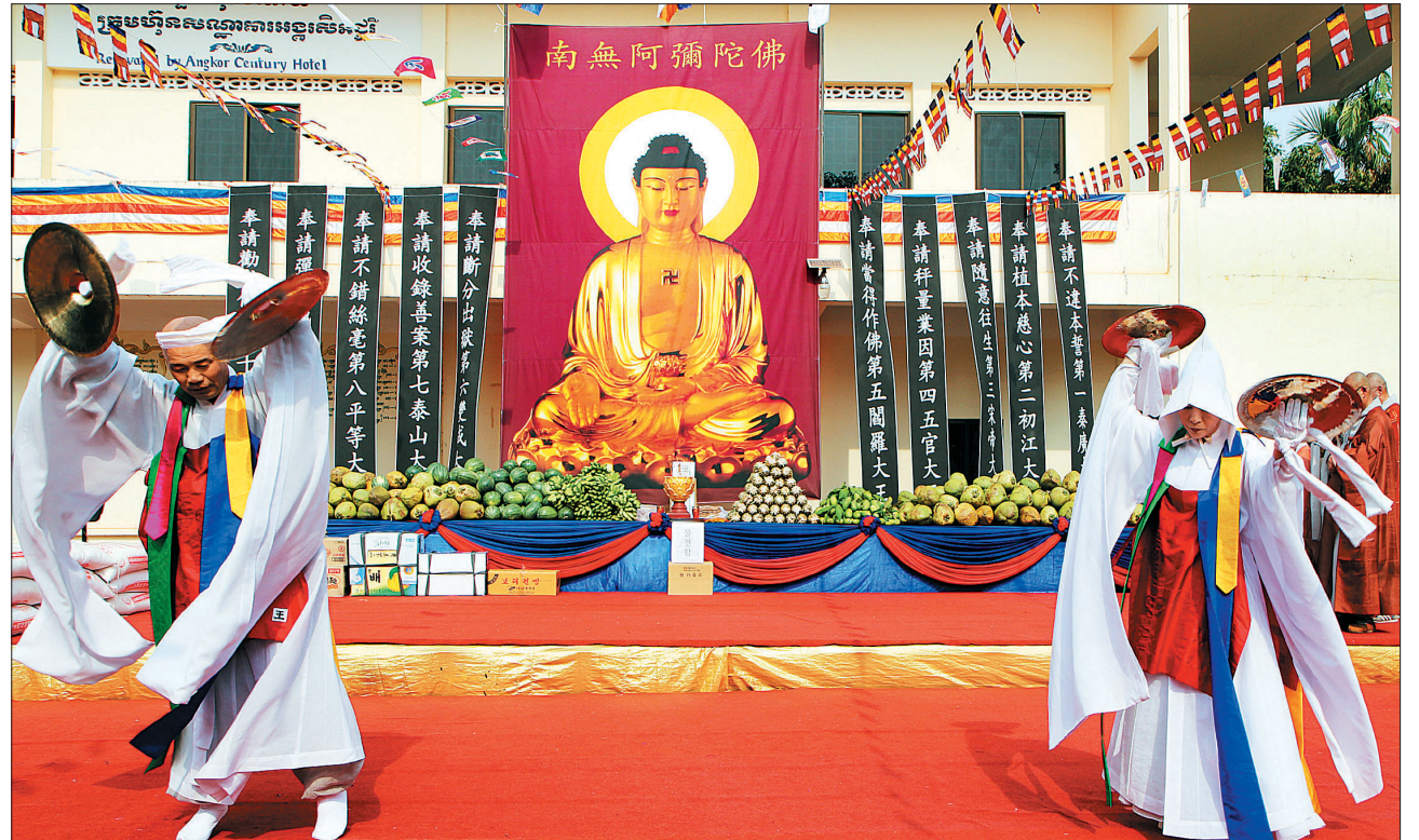
총사위로 캄보디아 고촌 극락왕생 발원