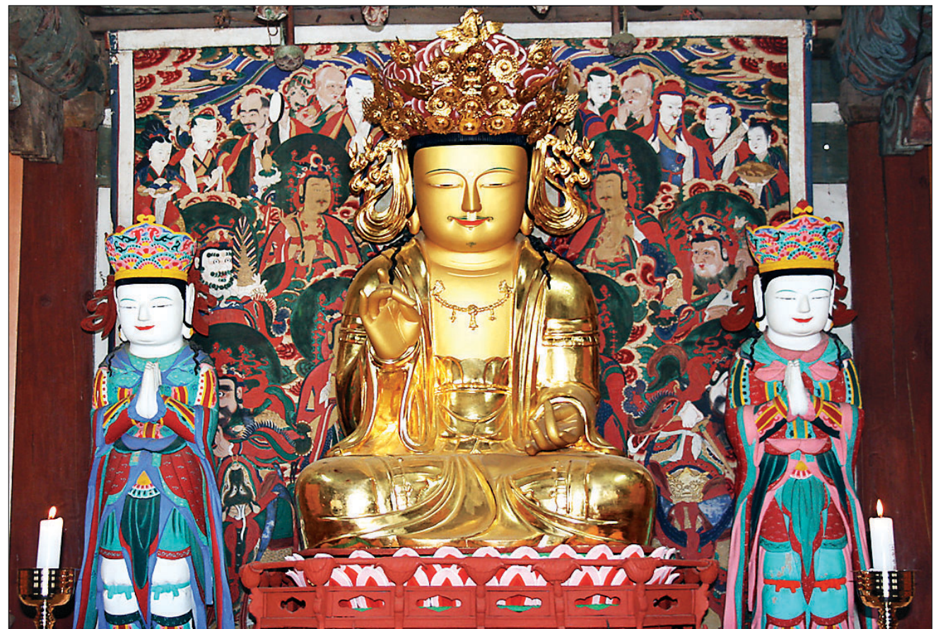
안성 칠장사 목조관음보살좌상. 1719년 일기 스님이 제작들과 만든 불상이다.

색난 스님 후배나 제자로 추정돼 생물 미상... 문헌 통해 활동 기능 부안 변산반도 능가산에 거주하며 주로 호남 지역을 중심으로 활동 조성·중수 불상 전국 10여 점 산재