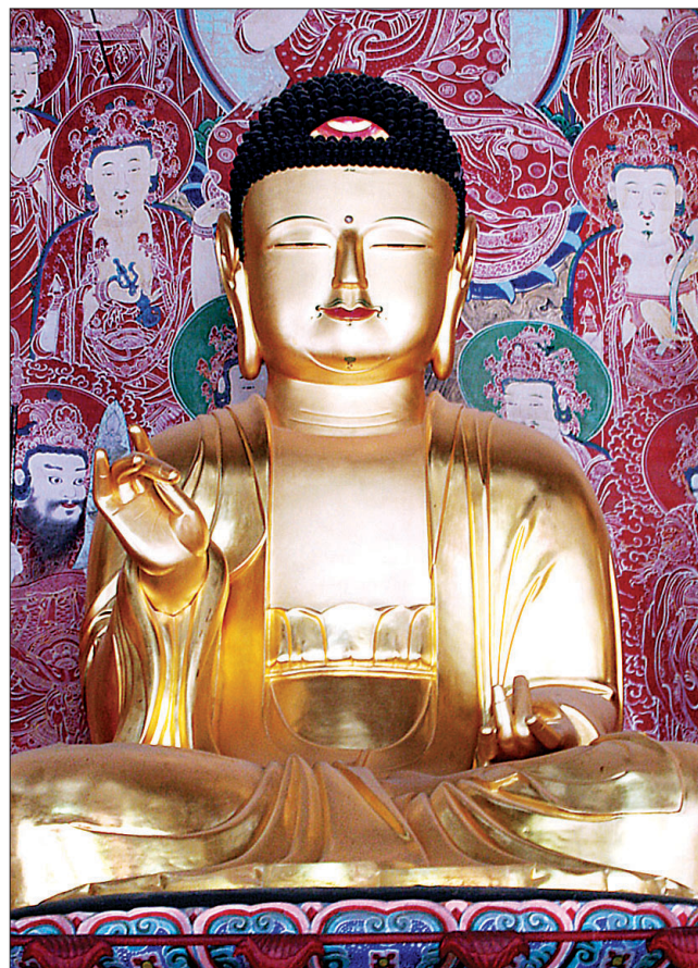
구례 화엄사 목조아미타여래좌상. 1703년 일기 스님이 주도적으로 만든 불상으로 그 실력이 매우 뛰어났음을 알 수 있다.

또한 스님은 색난 스님과 1701년에 호남 대흥사 응진전 불상과 1703년에 전남 구례 화엄사 각황전 목조칠존불상을 제작하였다. 화엄사 각황전은 원래 670년에 의상대사가 건립한 삼층