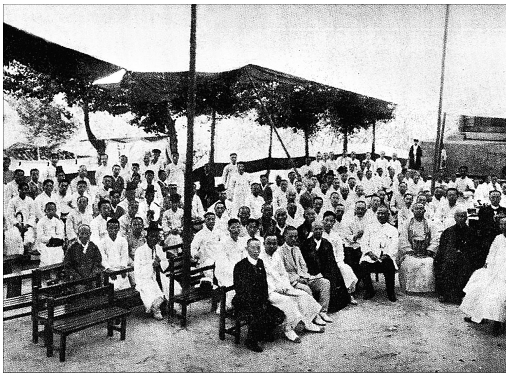
1915년 6월 20일 30본산연합사무소에서 개최된 불교진흥회 제1회 정기총회에 모인 불교계 인사들.

1895년에는 일본 일련종 승려 사노 젠레이의 주청을 계기로 이전 시대 불교 억압의 상징이었던 승려의 도성출입 금지조치가 해제되었다. 승려의 도성출입 허용에 대한 논의는 종교의 자유라는 측면에서 이전부터 제기되었지만, 청일전쟁의 승리로 일본의 정치적 입지가 강화된 상황에서 일본불교의 포교와 조선불교의 포섭을 위한 해제건의가 때마침 수용된 것이었다. 이에 조선불교계는 오랜 숙원이 해소되고 불교중흥의 기쁨이 마련되었다고 하여 감사와 환영의 뜻을 표시하였다. 당시 일본불교의 적극적 포교활동과 사회적