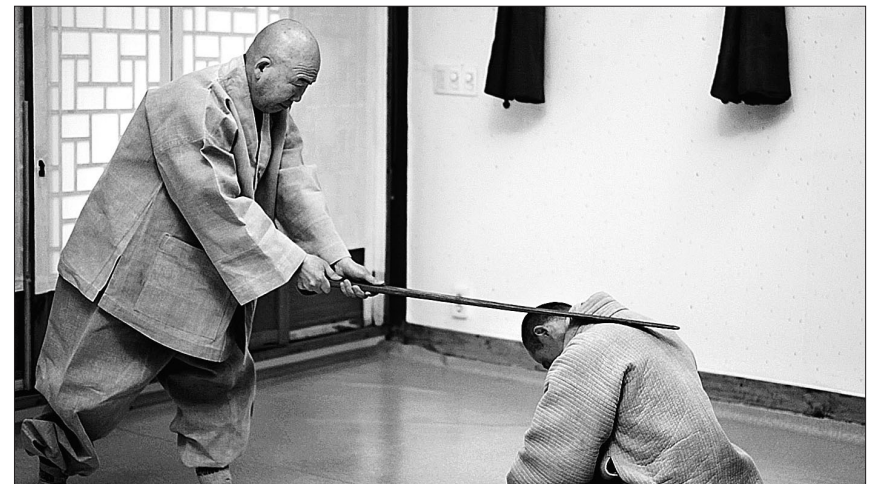
불교의 훈육 수단은 절복·섭수가 있으며, 선가(禪家)에서도 방과 할이 있다. 절복의 경우 강압적인 부분이 있지만 외적 성격보다는 지향성에 맞춰 해석해야 한다.

또한 불교적 관점에서 체벌 허용 여부는 본질적인 문제가 아님을 분명히 했다. 불가피하게 체벌을 해야 할 경우 체