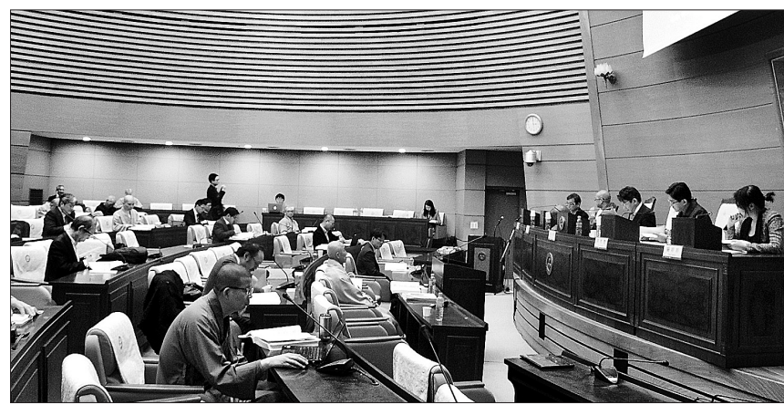
금강대 불교문화연구소 인문한국연구센터는 3월 26일부터 27일까지 한국불교역사문화기념관에서 ‘지론종 문헌과 정영사 해원’을 주제로 국제학술대회를 개최했다.

아직은 대중에게 지론종은 인도 유식학자 세친이 <화엄경> ‘십지품’에 대해 주석을 단 <십지경론>을 연구했던 분과다. 510~580년까지 중국 북부에서 융성했던 지론종은 천태·화엄·선·정토 등 중국 종파불교가 성립에 초석이 됐다. 중국불교 사상사의 뿌리와 같은 지론