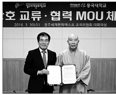
동국대와 경주세계문화엑스포는 3월 30일 경주세계문화엑스포 조직위원회 대회의실에서 상호협력을 위한 업무협약을 체결했다.

스포와의 협력은 문화융성의 핵심인 문화콘텐츠분야에서 큰 시너지 효과를 거둘 것”이라며 “지속적인 협력을 통해 공동의 목표를 달성하고 양 기관이 발전할 수 있는 좋은 기회가 되길 바란다”고 밝혔다.