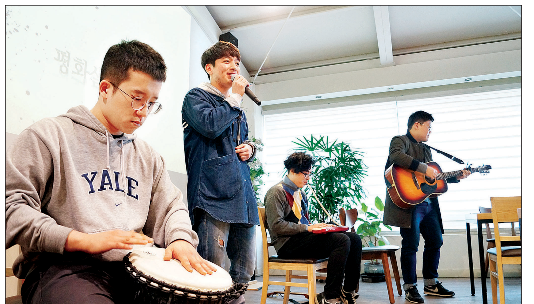
동국대 학생들로 구성된 그룹 ‘호구아트’가 평화살림콘서트 취지에 맞춰 ‘같이 살자’는 주제로 공연하고 있다.