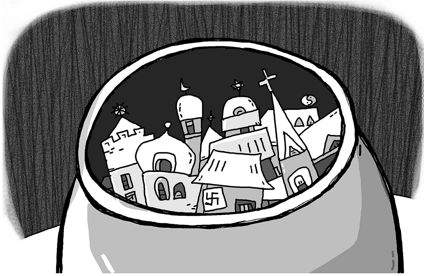
그림 · 최주현

또 오셔서 하는 소리가 "아이고, 나는 혼났어." "왜 혼났어요?" 아 글썩, 아침에 누가 모두 초청을 해서 갔는데 그 집에 층층대가 이렇게 있는데 그걸 아, 스님님 오시니깐 물로 잘 닦아 놔서 거 아닙니까. 닦아 놔는데 닦아 놓은 데서 물에 미끄러져 가지곤 그냥 거기에 디굴디굴 굴렀단 말입니다. 그래 가지고 허리를 다쳐 가지고요. 하이, 6개월을 앓을 쓰다가 인제 좀 괜찮아서 왔대요. 그러기에 그랬죠. 그것 때문에 물에 안 가시는 마음이니 그 마음에 말린 거지 판 사람이 준 게 아니라 이겁니다. 귀신이 있어서 준 게 아니고,