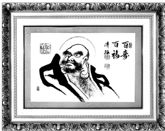
진품 소림 달마도 (수제 적외선으로 발송은 최대 7일까지 소요될 수 있습니다.)