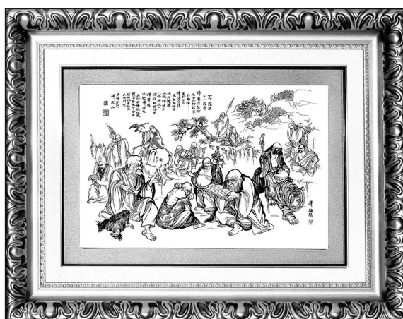
황금순금 나한도 (황룡상의 한자로 신이 깎게 나왔으나 실재로는 99% 황금색임)

진품소림달마도는 달마대사의 34대 제자이시고 대한호국불교 소림선종 방장이신 석연화 스님께서 글을 쓰시고 중국소림사 한국본부문화원 운영위원장 이신 청곡 이한동 화백께서 혼신의 힘을 다하여 완성하신 작품입니다.