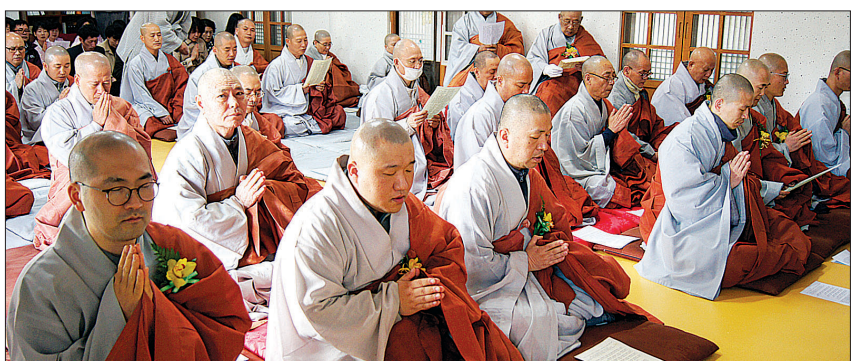
선운사 초기불교불학승가대학원 졸업·입학식에 참여한 스님들이 자비경 독경을 하고 있다.

해 "선운사가 초기불교승가대학을 설립한 것은 불교의 근원이 초기불교에 있다고 생각하기 때문이다"며 "초기불교대학을 졸업한 학인스님들은 선운사와 한국불교의 보람이자 희망이다"고 말했다.