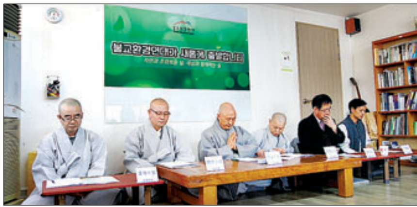
불교환경연대(상임대표 범일)는 3월 21일 조계사 신도회관 4층 사무국에서 신임 공동대표단 기자회견을 열고, 신임 공동대표단 및 재활성화를 위한 사업방향 등을 발표했다.

이번 순례길은 이명박 정부가 추진한 4대강 사업은 완료됐지만 더욱 악화되고