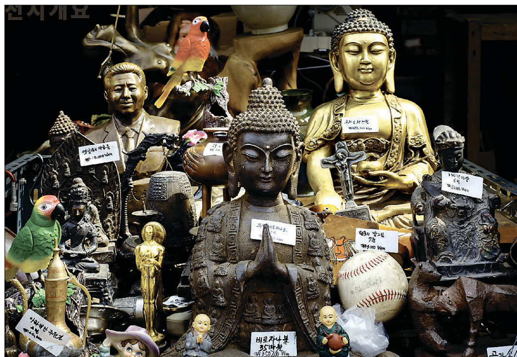
이완 작가의 사진 작품 'Product(2015)'. 황학동 시장 기념품 매대에 불상과 다양한 상품들이 가격표가 붙여 있는 상태로 진열돼 있다. 자본주의 사회에서 종교가 가지는 위치를 단적으로 보여준다.

이와 함께 BAF에는 '청년불교미술작가전' 등 다양한 전시들이 진행된다. 규모도 크다. 100여 명의 작가들이 67개 부스에서 작품을 선보일 예