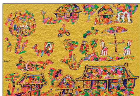
다비드 예가네의 작품 'Nostalgie'

이번 전시에 대해 불일미술관은 "형형색색의 화려한 빛깔을 통해 드러나는 한국불교 또한 그에게 생기발랄하고 환희에 찬 극락세계의 장엄과 유사하다"면서 "다비드 작가의 작품은 찬란한 원색으로 빛나는 고려불화의 이상향과 당당함이 작가가 꿈꾸는 극락이고 정토"라고 설명했다. (02)733-5332 신성민 기자