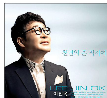
천년의 혼 직지여

이 씨는 본지와와의 통화에서 "최고 금속활자본인 <직지>는 선조들이 남긴 귀중한 문화유산"이라며 "<직지>가 가진 위대함과 환수의 염원을 담아 최대한 애절하게 가사를 썼다"고 말했다.