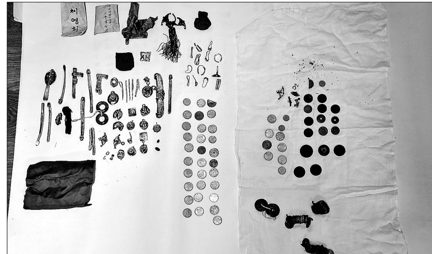
이천 영월암은 "3월 10일 대웅전 해체보수공사 중 상량문과 비녀, 화폐 등 당시 생활상을 알 수 있게 하는 상량유물 214점이 발견됐다"고 밝혔다. 사진은 이번에 발견된 유물들.

상량문·화폐·비녀 등 부장품 다양 중건 시기 확인... "건축사적 자료"