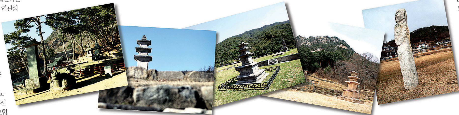
한국관광공사는 3월 가볼만한 곳으로 '지금도 사라진 옛 절터- 폐사지를 찾아서'를 주제로 폐사지 6곳을 선정했다. 사진 맨위가 충주 미륵대원지. 아래 왼쪽부터 경기도 양주 회암사지, 강원도 원주 거둔사지, 충남도 보령 성주사지, 경남도 합천군 영암사지, 전북도 남원 만복사지.

취는 거둔사지가 으뜸이다. 흥법사지는 아직 웅하고 법천사지는 전체가 발굴 중이다. 거둔사지는 발굴과 복원이 끝나 맑고 정갈하며 온화하다. 수령 1000년이 넘는다는 '돌을 먹고 사'는 느티나무도 자랑이다. 그늘 아래 잠시 쉬며 숨을 고르자.