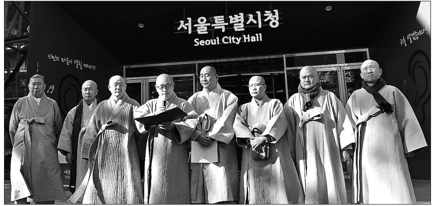
3월 10일 서울시장과의 면담 요청이 거절되자 환수위 스님들이 시청 앞에서 항의서한을 낭독하고 있다.

3월 23일 시청광장서 집회 예정 봉은사는 2월 24일부터 시위 시작 전국사찰, 현수막 게재 등 동조결의 교구본사주지협 “진상위도 꾸러야”