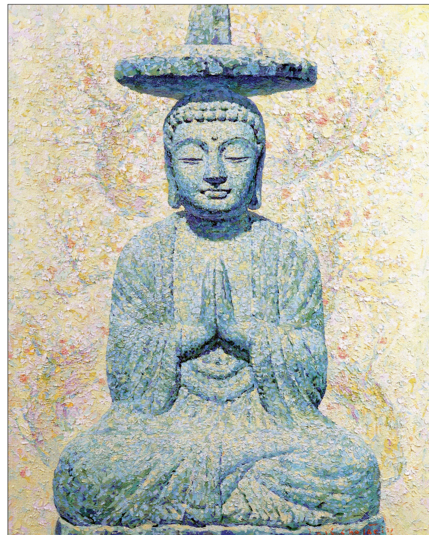
'붓다-꽃이 피다 I' (조재익 작)

리는 사람은 아마 없을 겁니다. 그만큼 불자들은 부처님에 대한 각별한 마음을 갖고 살아가죠. 앞으로는 사찰이나 많은 불자들이 찾는 곳에서 전시회를 열고, 함