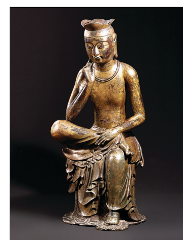
불교조각실에 전시돼 있는 국보 83호 금동미륵반가사유상.

또한 국립중앙박물관의 보존과학 40년 역사를 되돌아보는 특별전 '보존과학, 우리 문화재를 지키다' (3/9, 3/16, 3/23, 3/30)의 전시 설명도 계속해서 진행된다. 그동안 한국 문화재를 안전하게 지켜온