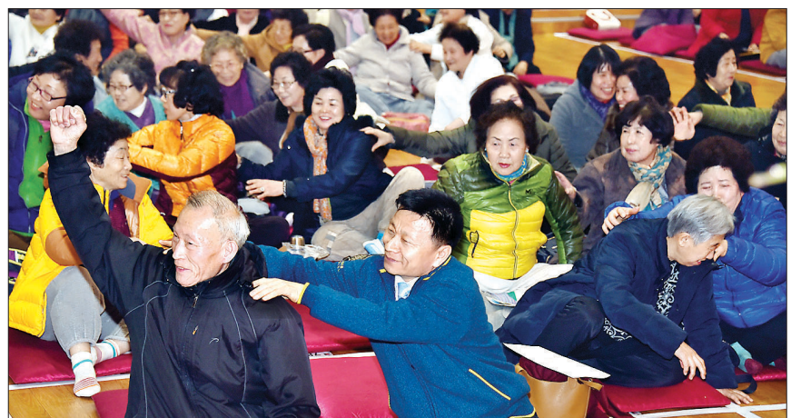
전문패널의 조언에 따라 주변인들과 교감하고 있는 콘서트 참가자들.

대와 편백나무숲, 차나무숲, 불두화숲, 무문등 목언명상경기를 체험할 수 있는 산책로다. 술길은 삼광사 뒤편에 조성된 치유공간으로 백천공원에서 극락전으로 이어져 있으며 천천히 걸어 올라가면 10여분이 소요된다. 하성미 기자