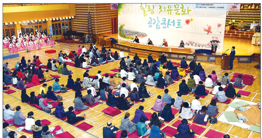
3월 1일 삼광사 지관전에서 열린 '힐링치유문화 공감콘서트'