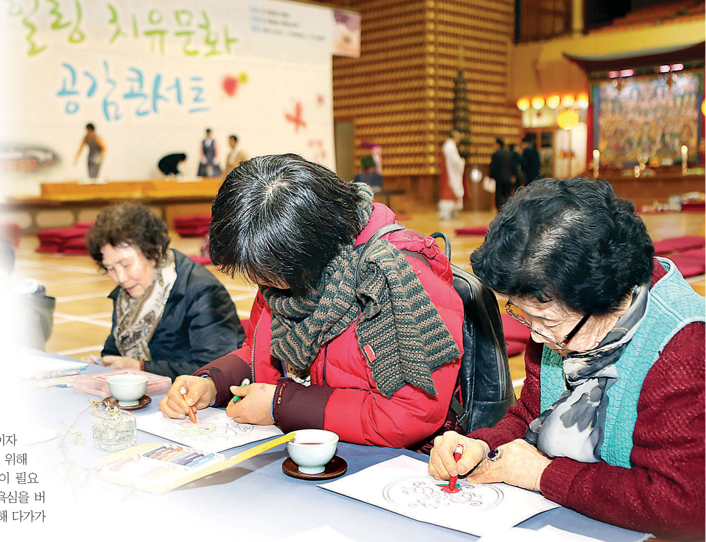
삼광사 '힐링치유문화 공감콘서트' 참가자들이 만다라 그리기를 체험하면서 마음의 안정을 찾고 있다.