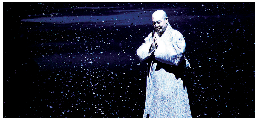
연극 '이뿏꼬'의 한 장면. 주인공 무명 스님의 삶을 통해 본질은 무엇인지를 묻는다.

보육원에서 자란 장선우는 사법고시에 합격하고 판사로 임용되는 임직적인 삶을 산다. 판사 임용 기념 가족여행을 떠난 날, 선우는 사고로 부인과 딸을 사