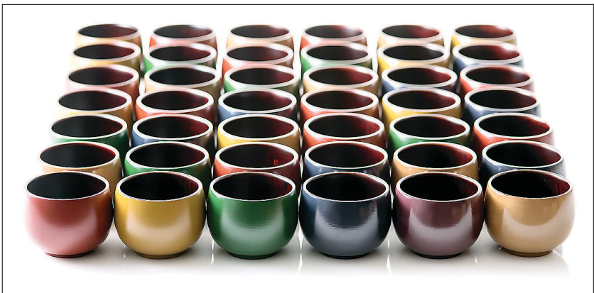
2016서울국제불교박람회 전통문화우수상품전 대상(조계종 총무원장상) 수상작 'RYU1987'의 '옷칠색잔'