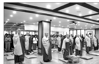
조계종 부산연합회는 2월 20일 재가자 동안 거 회향 법회를 봉행했다.

수진 스님은 “진리는 눈 뜨고 보면 바 로 여기 있고 눈 감으면 대천세계 다 찾 아봐도 없는 이치를 알지 못함이니 결 제라고 해서 결제하는 것이 아니며 해 제 때도 영원히 결제해야하는 것임을