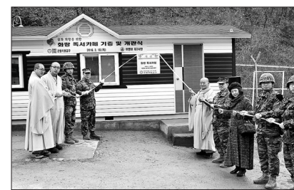
군종교구 스님들과 해병2사단 관계자들이 독서카페 현판제막을 하고 있다.