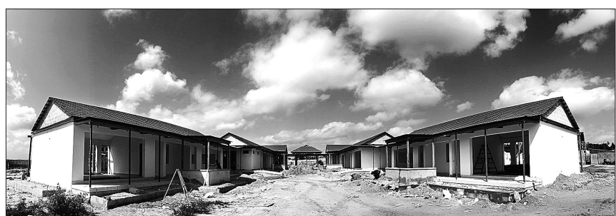
(재)아름다운동행이 2014년부터 보리가람농업학교 건립을 추진해 온 동행은 9월 5일 개교를 앞두고 있다.

동행은 개교 후에도 1:1 아동결연, 빈 곤아동 급식지원, 도서 및 교재 지원 등