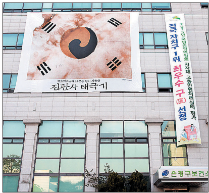
은평구 보건소에 계양된 백초월 스님의 진관사 태극기. 은평구는 2월 26일부터 3월 1일까지 주요 도로에 진관사 태극기 1300여 기를 계양했다.

이 같은 근대 문화재 발굴은 여러 방면으로 활용되면서 대중의 관심을 이끌어 내는 효과가 있다. 백초월 스님은 진관사 태극기와 함께 이미지 메이킹되면