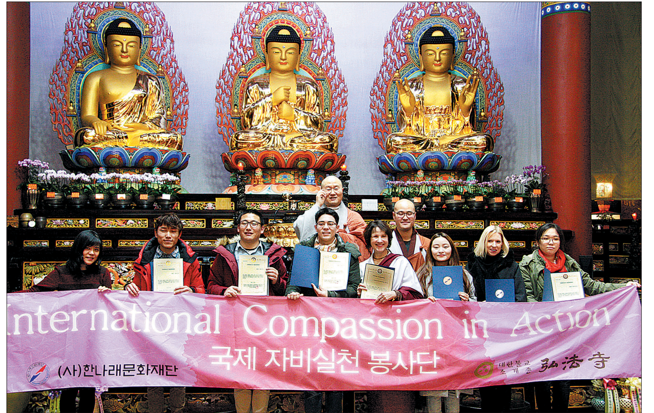
외국인 불자들이 봉사 전진기지 탄생