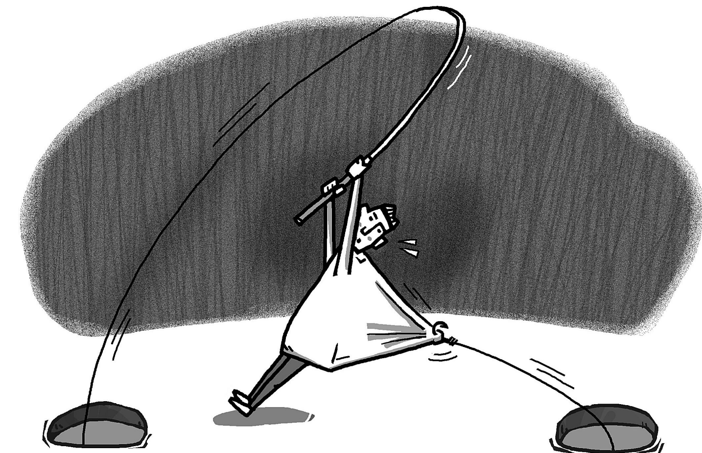
그림 · 최주현

지금 생활 불교로서 이끌어 가려니까 이렇게 내가 말을 하지 않고는 안 되겠어서 여러