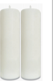
크리스탈 연꽃 받침대