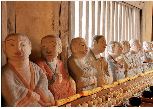
표정과 시선, 자세가 천태만상이다.