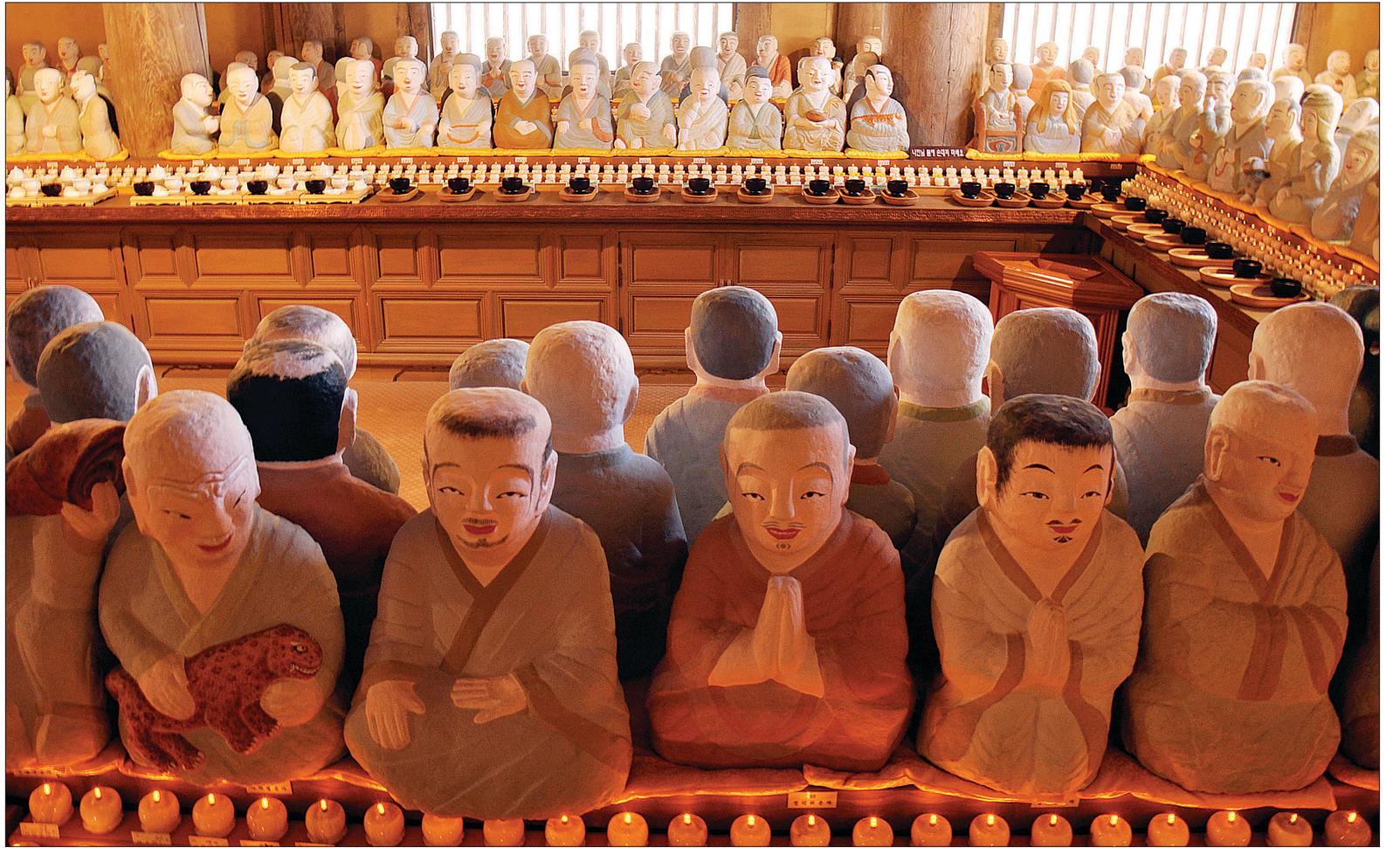
십대제자, 십육나한, 오백나한이 결집한 526체의 부처님 상수제자들.

지눌스님 정혜결사를 펼친 도량 나한(羅漢)은 범어 아라한(arhan)의 음역인 아라한의 줄임말이다. 아라한은 부처님의 제자로서 수행을 통하여 일체의 번뇌를 끊고 수행자들의 최고 계위인 아라한과(阿羅漢果)를 얻은 성자를 이른다. 공양 받아 마땅한 사람이라 응공(應供)으로도 부르고, 진리에 따르므로 응진(應眞), 또는 더 이상 배울 것이 없어 무학(無學)으로도 부른다. 불제자들은 경전에 따라 여러 숫자의 집합단위로 등장한다. <유마경>에서는 십대제자, 현장스님이 번역한 <대아라한난제대라소설법주기>에서는 십육나한, <증일아함경>, <오분율> 등에서는 오백나한으로 나온다. 십대제자, 십육나한, 오백나한 등은 부처님 사후 칠정굴에 모여 아난존자가 경을, 우배리존자가 율을 암송하여 경과 율을 결집한 '차결집'의 역사적 인물들이다. 동시에 <법화경> '오백제자수기품', '수기품' 등에서 광명여래(가섭), 명상여래(수보리), 전단향여래(목건련), 화광여래(사리불), 범명여래(부루나), 보명여래(교진여 비구와 500아라한) 등으로 석가모니 부처님으로부터 점차 부처로 수기(授記)를 받으신 경전상의 성자들이다. 미특하생 때까지 이 땅에 머물며 불법을 전하고 중생에게 자비를 베푸는 역할을 부촉 받았다.