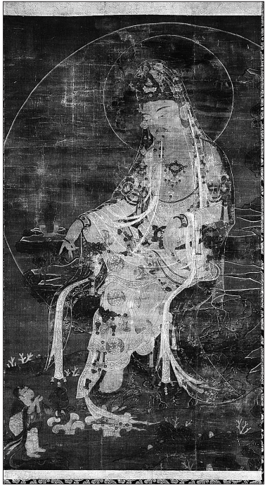
필름 동아시아박물관 소장 고려 수월관음도. 2017년까지 한국의 국립중앙박물관이 보존처리를 한다.