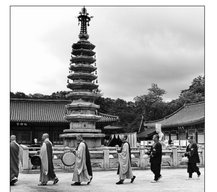
월정사탑돌이 재현 장면.

해의 무사안녕과 함께 국은 융창 등을 기원하는 전통행사였다”며 “평창 올림픽을 앞두고 문화올림픽의 성공개최와 지역문화 발전을 위해 탑돌이의 무형문화재 등재를 발원한다”고 밝혔다.