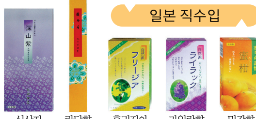
일본 직수입 심산자, 라단향, 후리자아, 라일락향, 밀감향

법당에서 초공양을 쉽게 올릴 수 있도록 연꽃 모양의 크리스탈 받침대와 밀납양초로 손쉽게 양초를 교체할 수 있는 신제품을 개발하였습니다. 밀납양초는 특수 PC캡을 이용하여 화재위험을 완벽하게 방지 하도록 설계되어 있어 법당 및 야외 어디서나 안전하게 초공양을 올릴 수 있습니다.