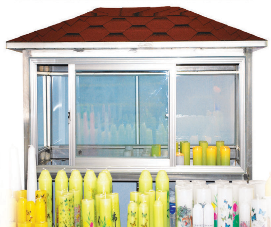
실외 양초 공양집